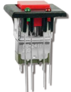
MB2400 系列按钮 带有备用 AT212 槽板 和 AT617 LED

M 系列翘板, EB 系列按钮和 MB2400 中使用的 AT618 LED 和 AT213 边框系列按钮将停止使用。这将包括 AT618 的红色, 黄色和绿色 LED。AT213 挡板可容纳两个矩形 AT618 LED, 备用 AT212 挡板可容纳两个圆形的 AT617 LED。下表的 LED 规格表比较了这些值在 AT618 和 AT617 LED 之间。第 2 页显示了停产的挡板和 LED, 备用边框和 LED, 以及一个表格, 其中列出了已停产的部件号和备用零件号。所做的更改将同时影响标准和自定义开关。