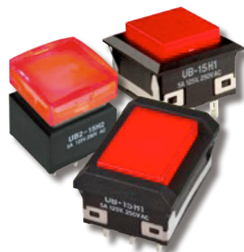
UB&UB2 系列的红光亮 LED

UB系列的发光按钮开关和指示灯的红高亮LED规格变更(LED厂家停产),变更将导致与以前的LED电气参数存在差异,此次变更包括标准型号和定制型号。下表是规格变更前后的对照参数,具体的开关型号请参照第二页。