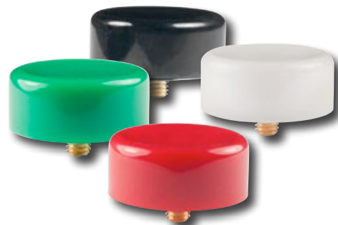
螺纹式盖帽 AT412 的示例图片