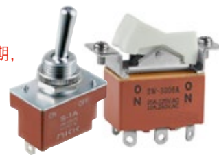
S 系列 /SW 系列的示例图片

此次变更通知是对第 418 号的补充说明，该变更通知在第 1 页备注中指出：“由于此变更，UL 认证将从 UL1054 更新为 UL61058 - 1，额定电压为 125V AC。”下记说明是 S 系列摇头开关和 SW 系列翘板开关的三项变更内容。受影响的是两个系列的标准产品和定制产品，标准型号请参照第 2 - 4 页。