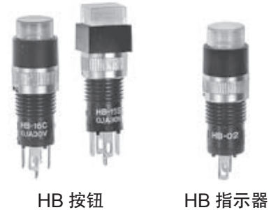
高亮度发光二极管代码及规格

HB 系列带灯按钮及指示器将更改为高亮度发光二极管。这些更改将对全部的标准及定制模型的照明设备产生影响。下表中已标明发光二极管规格值差异，此外也包括 AT633 发光二极管的尺寸变更。