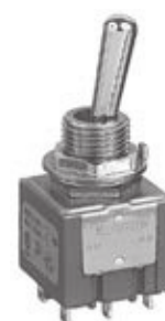
带有 12mm 衬套和大球杆的 P 摇头开关

2. 将在带有 12mm 衬套和大球杆 (代码 B) 的 P 摇头开关的杆上安装白色盖子 (见合同 296)。盖子安装后，带有大球杆的 P 摇头开关将继续遵循 VDE 标准，但将失去 UL 和 CSA 认证。若没有盖子，开关将失去 VDE 认证 (不会影响 UL 和 CSA 认证)。代码 F 已经被指定用于此新增项 (无盖大球杆)，见下页订购表。其中还包括各类杆的修订标准和认证以及修订的批准状态的说明。