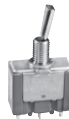
带有 6mm 衬套和平杆的 P 摇头开关