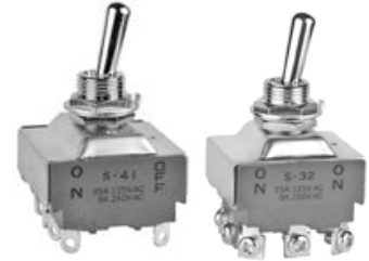
S30 系列和 S40 系列摇头开关

1. S30 系列和 S40 系列摇头开关的生产更改。产品上不再出现产地，NKK 标志将被更新。开关批号上的第一位数字上有点标记。设备运输包装箱上印有“PHILIPPINES FACTORY”，而非“JAPAN FACTORY”。这些更改适用于所有标准产品，定制产品和一些标准认证产品。受影响的标准件号如下。